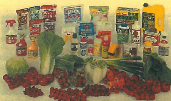
純果育ち ブランドの野菜